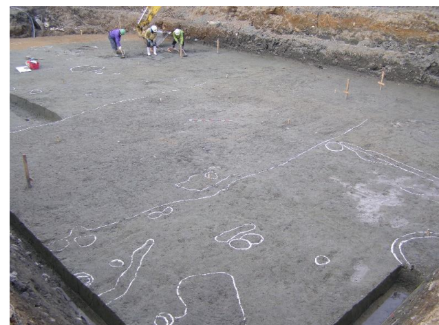
東側の調査地から見つかった遺構 （今回の見学範囲）