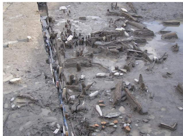
西側の調査地から見つかった自然流路 （既に埋め戻し済み）