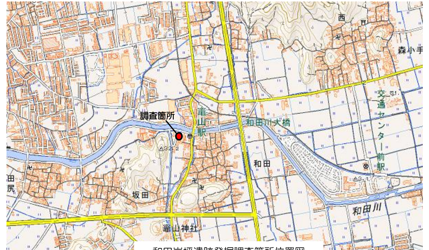
和田岩坪遺跡発掘調査箇所位置図