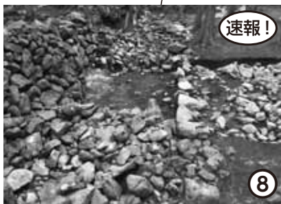
道湯川集落跡(田辺市)