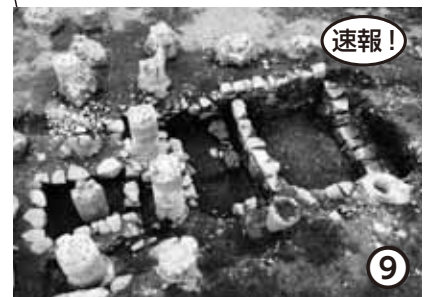
新宮城下町遺跡(新宮市)