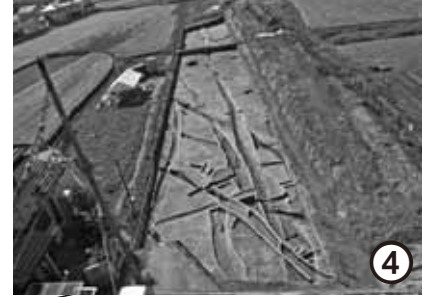
川辺遺跡(和歌山市)