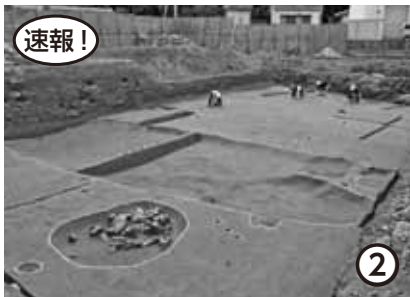
和田岩坪遺跡(和歌山市)