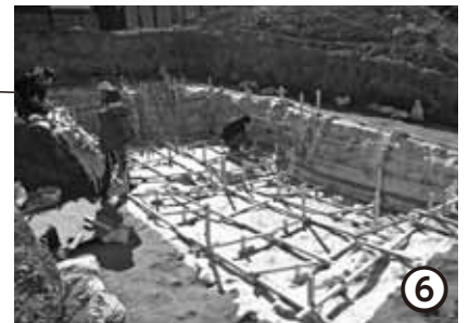
根来寺遺跡(岩出市)