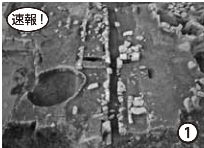
和歌山城跡(和歌山市)