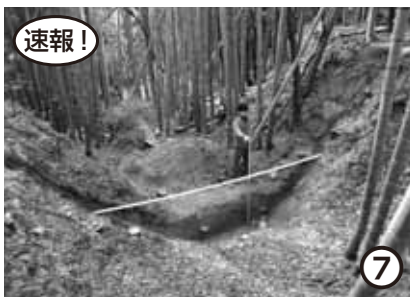
湯浅城跡(有田郡湯浅町)