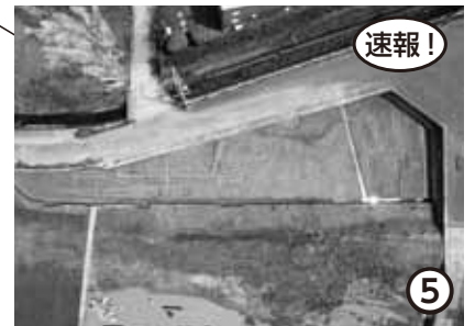
吉礼Ⅲ遺跡(和歌山市)