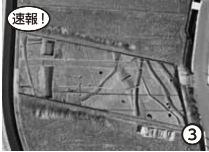
田屋遺跡(和歌山市)