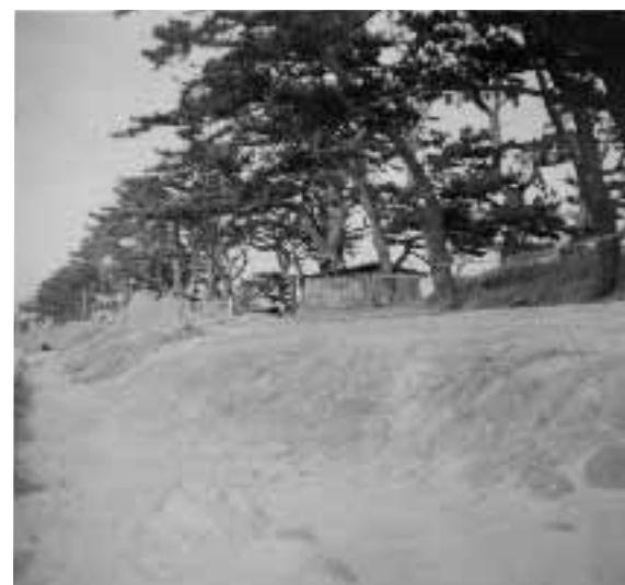
水軒堤防の古写真