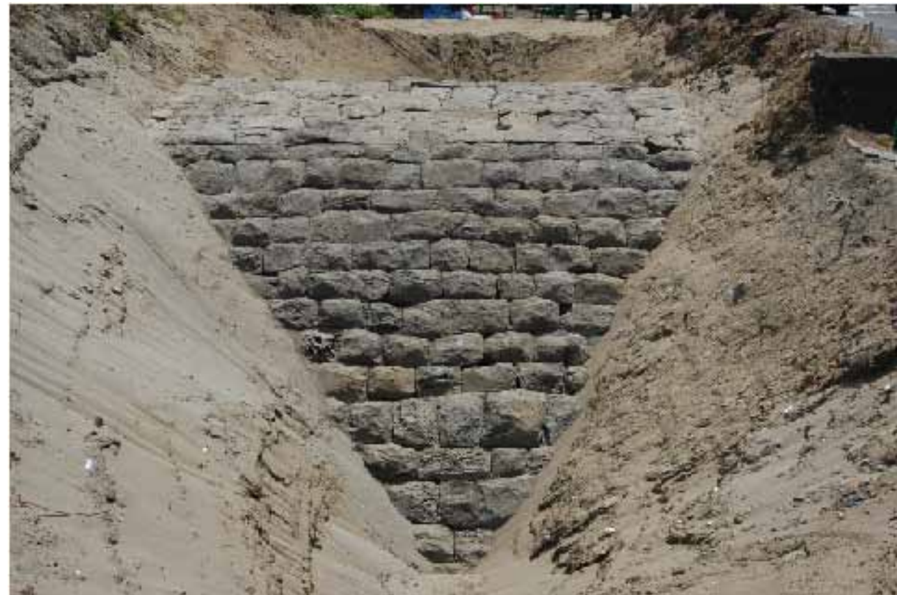
石積み堤防 西側(海側)

また、石材は表面が丸く膨らむように周辺部を加工しており、この技法はこぶ出しと呼ばれ、寛文年間(17世紀中頃)に積まれた金沢城の石垣にもこの技法が見られます。金沢城では本丸や二ノ丸などに見られる石垣の技法で、視覚効果をねらったものと考えられますが、今回検出したものは堤防に使用されており、凹凸を作り出すことにより波の力を分散させる効果を狙ったものと考えられます。石積みが緩やかな勾配で構築されていることもあわせて考えると、土木工学的な考え方が取り入れられていることがわかります。