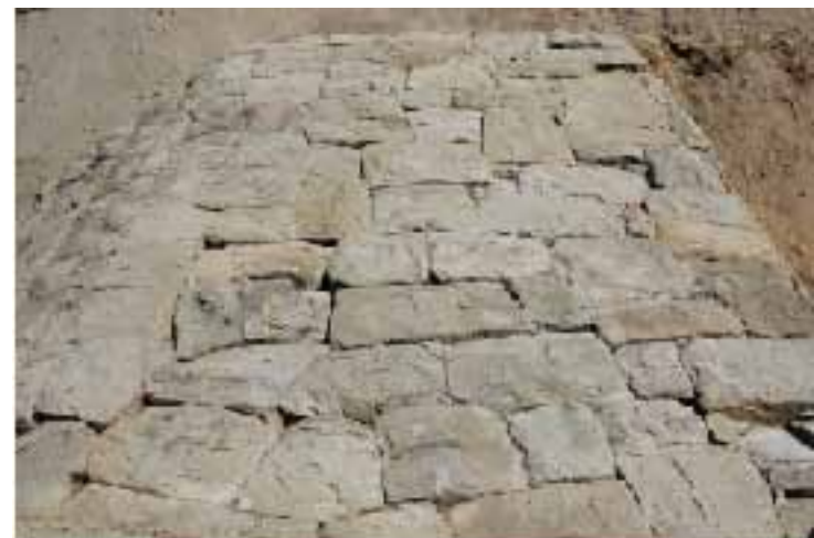
石積み堤防 上面(南から)

水軒堤防は、和歌山県の防災の歴史を考えるうえで、19世紀に浜口梧陵が完成させた広川町に所在する国指定史跡広村堤防と並んで貴重な歴史遺産であるとともに重要な土木遺産です。