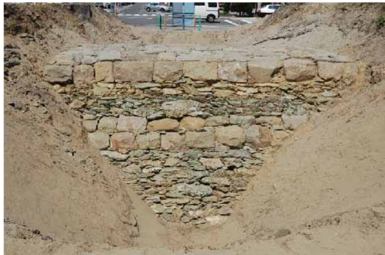
石積み堤防 東側(陸側)

東側の石積みは、中央部に砂岩を2列積んでいますが、西側の砂岩と違って粗い加工しかしていません。この砂岩の列より下方の結晶片岩は、それほど大きな石材を使用していないものの丁寧に積んでいます。上方の結晶片岩はやや雑に積んでいる感じがおり、上下で石の積み方に違いがあります。この東側石積みの砂岩列下端と西側石積みの上から9段目下端のレベルがほぼ同じであり、両側とも下方が大きな石材で丁寧に積んでいることが共通しています。