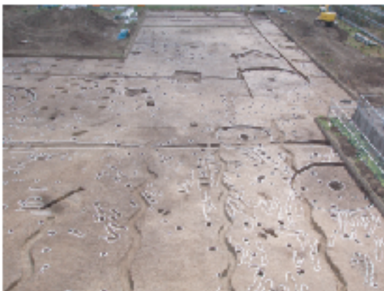
調査区全景 (北から)

検出した遺構には弥生時代後期中頃(約一九〇〇年前)から後期末頃(約一八〇〇年前)にかけての堅穴住居7棟(住居1〜7)・溝状遺構4条(溝1〜4)・土器棺墓1基、古代と考えられる掘立柱建物8棟(