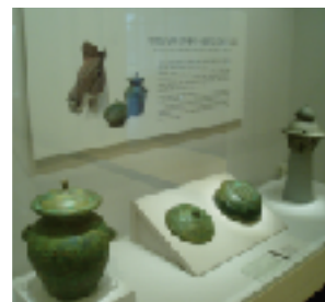
高句麗の影響を受けた金属器