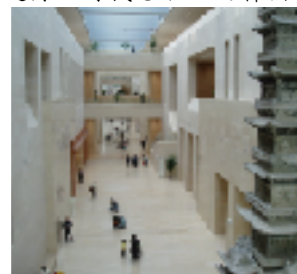
1F 左：考古館 右：歴史館