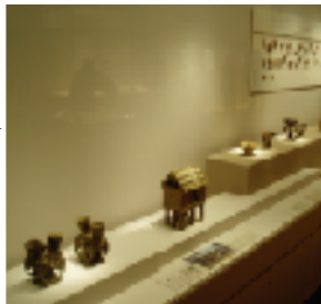
新羅土器：中央に家型はぞう