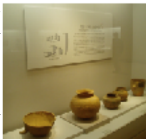
原三国時代の土器