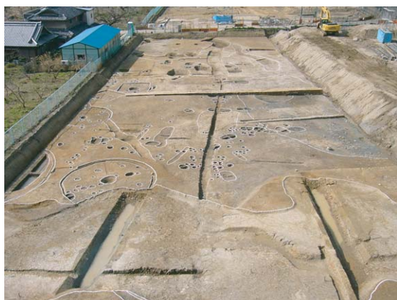
2 B 1 区全景

西飯降 遺跡で5棟、丁の町・妙寺遺跡で3棟の竪穴住居が見つかりました。平面形は大半が円形（写真5372住居）で、直径約8m前後の大きさです。2B1区では方形住居が1棟検出され、一辺4mと円形に比べて小型の住居です。住居にはいずれも中央に炉を設置しています。弥生時代中期の竪穴住居は他遺跡でも平面円形が一般的で、後期になると方形住居が増加していきます。西飯降 遺跡の集落の西側は方形周溝墓や土器棺墓が点在し、墓域として利用されていたようです。方形周溝墓の棺を納めた主体部の墳丘は後