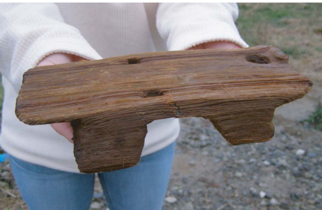
古墳時代後期の下駄

完形の石剣(写真)が出土しました。材質は粘板岩で、刃先部分を中心によく磨かれた精良品です。磨製石剣は近畿地方を中心に多数出土していますが、そのほとんどは破片の状態です。和歌山県内でもこれまで数例しか出土していません。【下駄】1B3区 of 古墳時代後期の46溝から下駄(写真)が見つかりました。下駄は台と歯を1本の木から削りだした連歯式です。現代の形状と近似していますが、鼻緒の位置が中央で