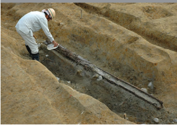
3区平安時代後期の木樋出土状況