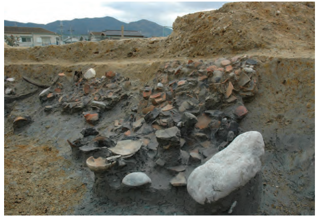
■ 3区弥生時代中期の川跡の土器出土状況

川跡に落ち込んだ大量の土器が見つかりました。集落の中心は調査区外の南側に広がるようです。弥生時代後期（約1900～1700年前）は住居跡4棟があり、このうちの1棟は、長辺約6mの長方形で6本柱をもつ珍しい形の住居です。隣の西飯降Ⅱ遺跡でも、弥生時代中期から後期にかけて集落が営まれており、この地域における弥生時代のムラの景観が明らかになりました。 古墳時代初頭（約1700年前）は、溝や土坑がありますが調査区内で住居