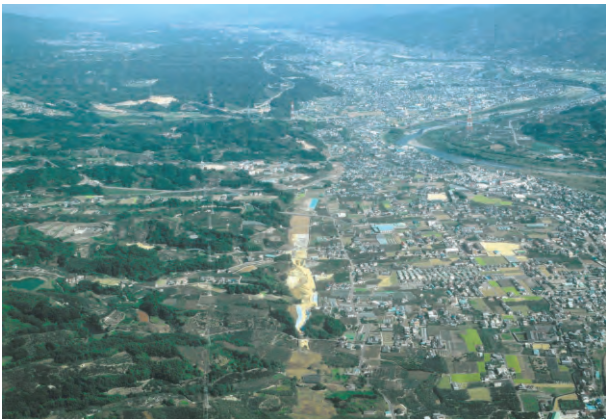
調査地上空から東（奈良方面）を望む

年（平安時代後期）には高野山領の莊園として官省符莊が成立し、河北方・河北方・下方と広大な莊園に拡大したことが知られています。当遺跡が属する下方の妙寺条里区も古代末期には開発されていたと考えられ、3区の水路跡はその用水路でしょう。