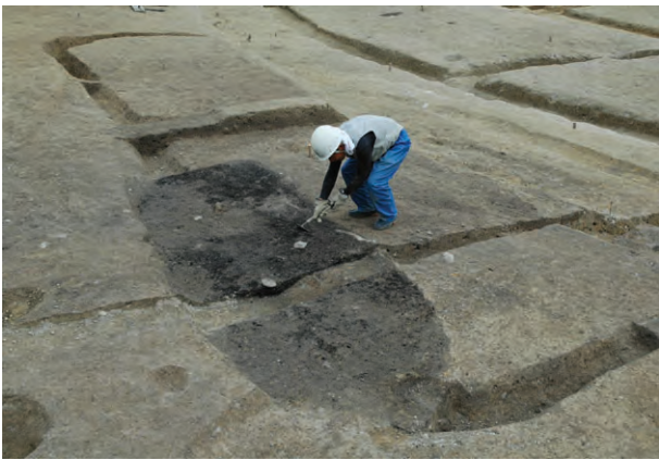
2区鎌倉時代の工房跡