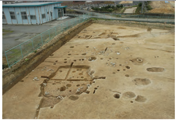
■ 3区縄文時代後期の集落跡

縄文時代後期（約4500～3000年前）のまとまった集落跡は、和歌山県内では貴重な発見となりました。竪穴住居4棟のほか、土器棺墓 ぼ 、配石・集石遺構が見つかりました。土器棺墓には、紀ノ川流域産の結晶片岩を標石として置いていました。また北陸産と思われる蛇紋岩製の磨製石斧 ませいせき 1点と、二上山産サヌカイト製の石器や多数の石材が出土しました。 弥生時代中期（約2200～1900年前）は住居跡2棟と、谷筋の