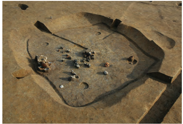
■ 3区古墳時代後期の竪穴住居跡

跡は見つかりませんでした。古墳時代後期（約1500～1400年前）になると、再び集落が営まれ、カマドをもつ住居4棟が見つかりました。平安時代後期（約1000～900年前）は、谷筋に直交する幅約7m、深さ1mの水路跡が見つかりました。川底や岸には、水量調節のために、杭が多数打ち込まれています。また、この水路から南方へ分流する溝には、木樋が設置されていました。木樋は長さ約4mで、角材を割りぬき木の蓋をしたものです。1049