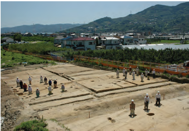
1区平安時代前期の掘立柱建物群