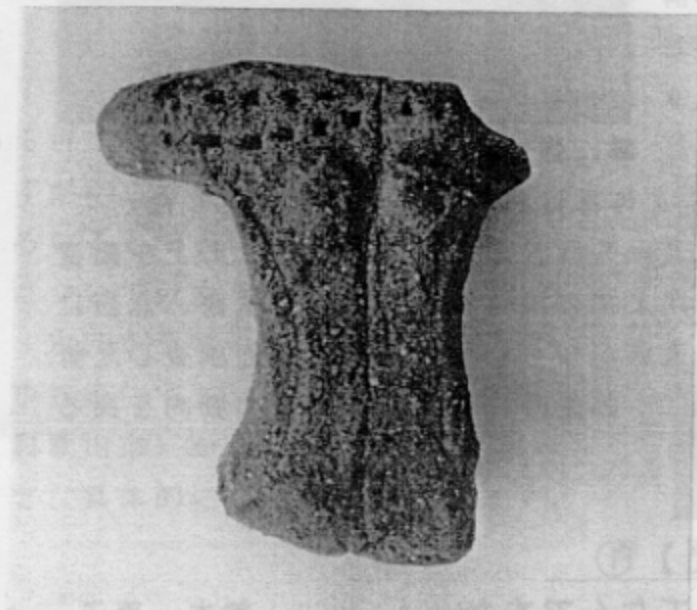
■ 柏原遺跡出土 土偶（頭部・左腕欠失）

Tel : 073 (433) 3843 Fax : 073 (425) 4595