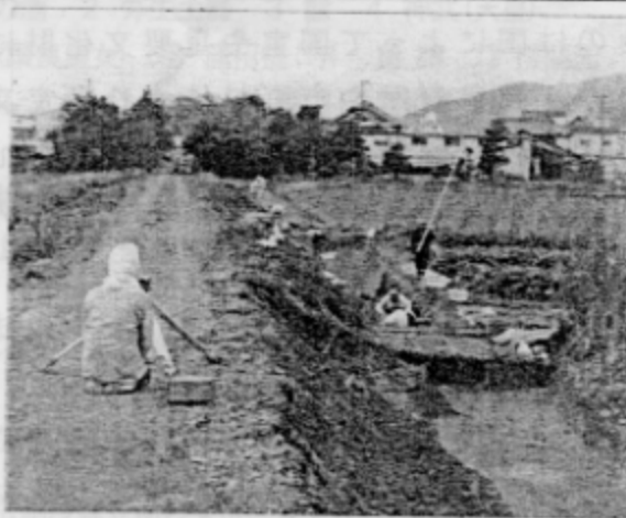
■ 野上中南遺跡 調査風景

今回の調査は、道路の北側溝建設予定地を先行調査するもので、平成15年11月4日から12月12日まで、当センターが発掘調査にあたりました。幅約2m、