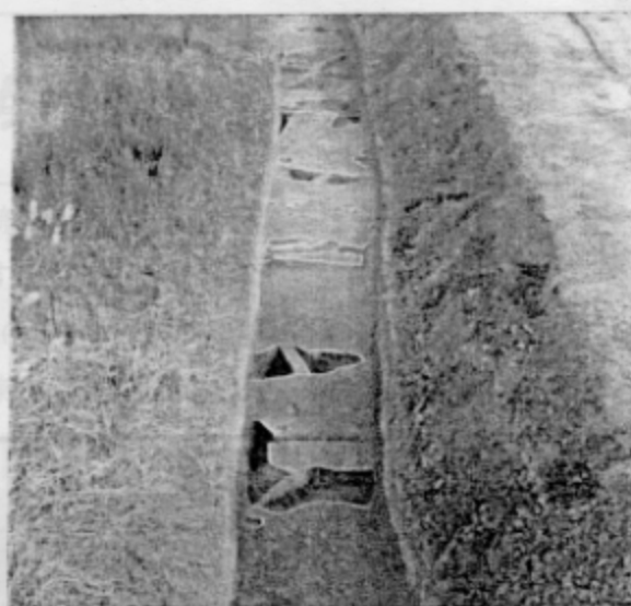
■ 弥生時代の方形周溝墓1・2

方形周溝墓とは方形・長方形の墳丘に溝を廻らす形態の墓で、弥生時代に通有のもので、確認した方形周溝墓は墳丘部3.0～4.0m、周溝の幅0.5～1.0m、深さ0.3